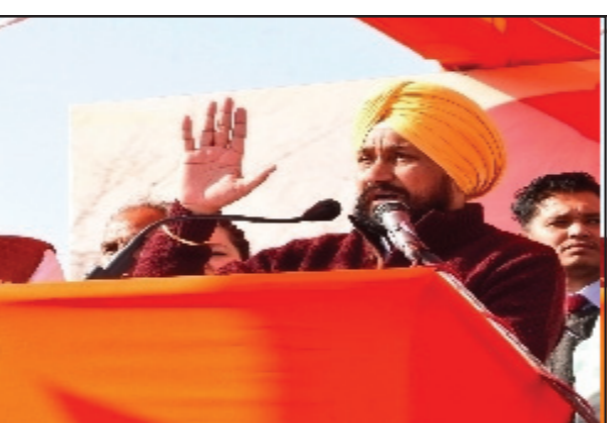
ਨੇ ਉਦਘਾਟਨ ਅਤੇ ਨੀਂਹ ਪੱਥਰ ਵੀ ਰੱਖਿਆ ਜਿਸ 'ਚ 137 ਕਰੋੜ ਰੁਪਏ

ਘਨੌਰ, (ਪੱਤਰ ਪ੍ਰਕਾਸ਼)- ਕੈਪਟਨ ਅਮਰਿੰਦਰ ਸਿੰਘ ਬਾਦਲਾਂ ਨਾਲ ਹੀ ਗਿੱਧੇ ਨਿਬਾਉਂਦੇ ਰਹੇ ਹਨ। ਜਿੰਨਾ ਚਿਰ ਅਕਾਲੀ ਦਲ 'ਚ ਸੁਖਬੀਰ ਸਿੰਘ ਬਾਦਲ, ਬਿਕਰਮ ਸਿੰਘ ਮਜੀਠੀਆ ਵਰਗੇ ਆਗੂ ਹਨ, ਉਨੀ ਦੇਰ ਅਕਾਲੀ ਦਲ ਦੁਬਾਰਾ ਸੱਤਾ 'ਚ ਨਹੀਂ ਆ ਸਕਦਾ। ਇਹ ਪ੍ਰਗਟਾਵਾ ਘਨੌਰ ਵਿਖੇ ਰੈਲੀ ਨੂੰ ਸੰਬੋਧਨ ਕਰਦਿਆਂ ਮੁੱਖ ਮੰਤਰੀ ਚਰਨਜੀਤ ਸਿੰਘ ਚੰਨੀ ਨੇ ਕੀਤਾ। ਮੁੱਖ ਮੰਤਰੀ ਨੇ ਬਿਕਰਮ ਸਿੰਘ ਮਜੀਠੀਆ ਨਸ਼ਿਆਂ ਦਾ ਬਰਾਂਡ ਗਰਦਾਨਦਿਆਂ ਕਿਹਾ ਕਿ ਮਜੀਠੀਆ ਇੰਨੇ ਸਾਲ ਇਸ ਲਈ ਬਚਿਆ ਰਿਹਾ ਕਿ ਉਹ (ਕੈਪਟਨ ਅਮਰਿੰਦਰ ਸਿੰਘ) ਚਾਚਾ-ਭਤੀਜਾ ਰਲ ਕੇ ਚੱਲ ਰਹੇ ਸਨ ਤੇ ਕੈਪਟਨ ਨੇ ਮਜੀਠੀਆ 'ਤੇ ਪਰਚਾ ਦਰਜ ਨਹੀਂ ਹੋਣ ਦਿੱਤਾ। ਮੁੱਖ ਮੰਤਰੀ ਨੇ ਮਰਹੂਮ ਆਗੂਆਂ ਜਥੇਦਾਰ ਗੁਰਚਰਨ ਸਿੰਘ ਟੌਹੜਾ, ਜਥੇਦਾਰ ਜਗਦੇਵ ਸਿੰਘ ਤਲਵੰਡੀ, ਮਾਸਟਰ ਭਾਈਚਾਰਕ ਸਾਂਝ ਨੂੰ ਯਾਦ ਕਰਦਿਆਂ ਕਿਹਾ ਕਿ ਸੁਖਬੀਰ-ਮਜੀਠੀਆ ਦੀ ਜੋੜੀ ਨੇ ਅਜਿਹੇ ਮਹਾਨ ਆਗੂਆਂ ਦੇ ਅਕਾਲੀ ਦਲ ਨੂੰ ਤਬਾਹ ਕਰ ਕੇ ਰੱਖ ਦਿੱਤਾ ਹੈ। ਆਮ ਆਦਮੀ ਪਾਰਟੀ ਨੂੰ ਲੰਮੇ ਹੱਥੀਂ ਲੈਂਦਿਆਂ ਮੁੱਖ ਮੰਤਰੀ ਨੇ ਕਿਹਾ ਨਸ਼ਿਆਂ ਦੇ ਮਾਮਲੇ 'ਚ ਕੇਂਦਰੀਵਾਲ ਨੇ ਮਜੀਠੀਆ ਅੱਗੇ ਗੋਠ ਟੇਕ ਦਿੱਤੇ ਜਿਸ ਕਰ ਕੇ ਇਸ ਦੇ 10 ਵਿਧਾਇਕ ਤੇ 3 ਸੰਸਦ ਮੈਂਬਰ ਇਸ ਤੋਂ ਕਿਨਾਰਾ ਕਰ ਗਏ। ਚੰਨੀ ਨੇ ਘਨੌਰ ਨੂੰ ਸਭ ਡਵੀਜ਼ਨ ਬਣਾਉਣ ਦਾ ਐਲਾਨ ਕੀਤਾ ਹੈ। ਕਰੀਬ ਪੌਣੇ 269 ਕਰੋੜ ਰੁਪਏ ਦੇ ਵਿਕਾਸ ਕੰਮਾਂ ਦਾ ਮੁੱਖ ਮੰਤਰੀ